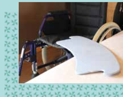
PLANCHE DE TRANSFERT

Permet le transfert d'une assise à l'autre (ex. d'un lit à un fauteuil)